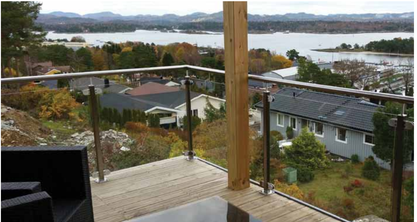
Toppmontert rekkverk med klare glass og stolper i syrefast stål 316