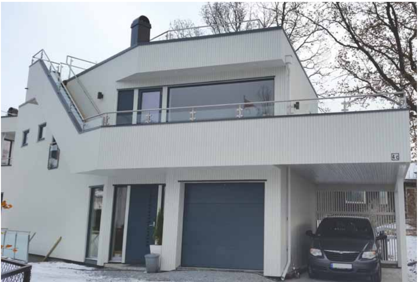
Disse rekkverkene leveres med det samme som med runde stolper